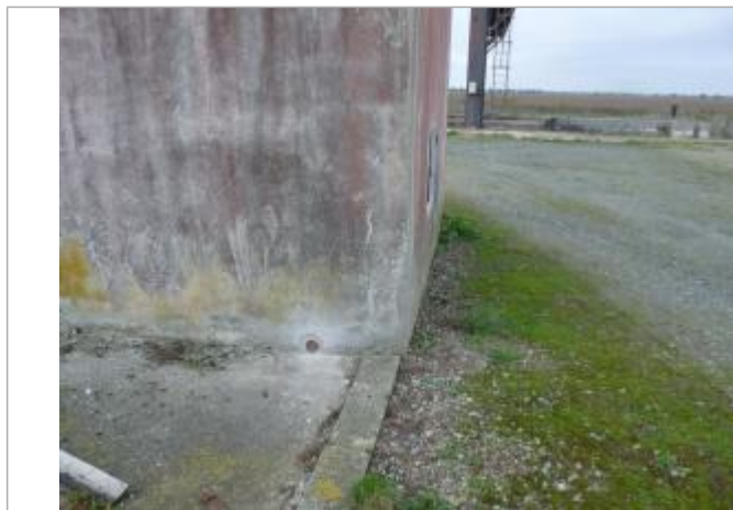
localisation du repère

Altitude calculée de l'eau (en m) : 4.19 m