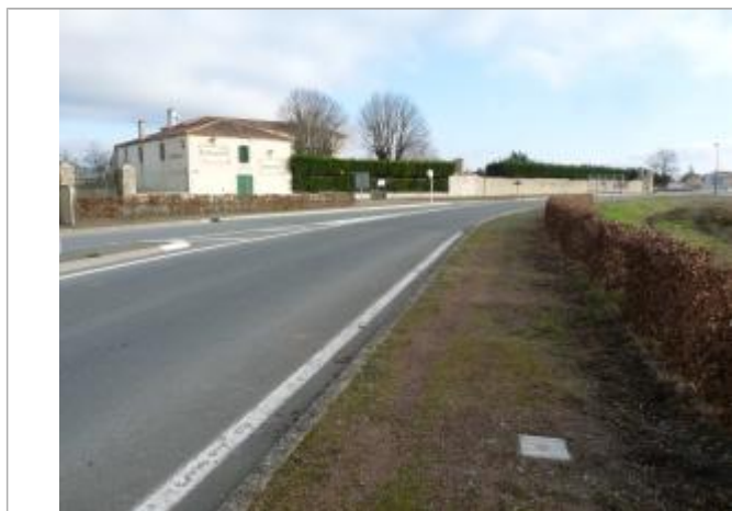
localisation du repère