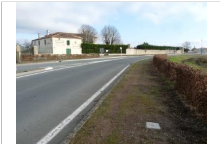
localisation du repère

Texte : Xynthia 2010 Visibilité : Oui État du repère : Bon Pérennité : Longue