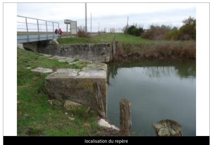
localisation du repère