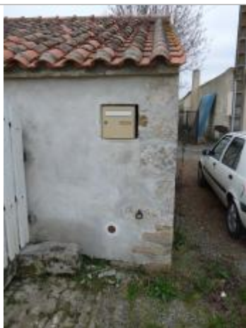
localisation du repère

Altitude calculée de l'eau (en m) : 4.03