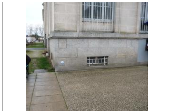
localisation du repère