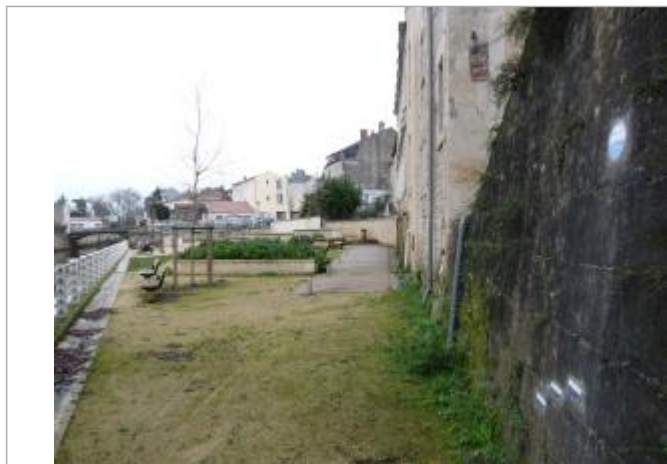
localisation du repère