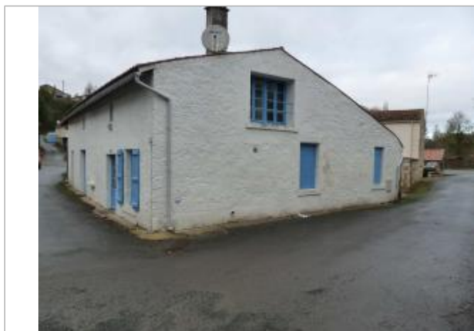
localisation du repère