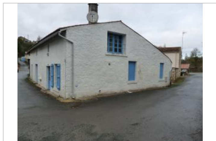
localisation du repère