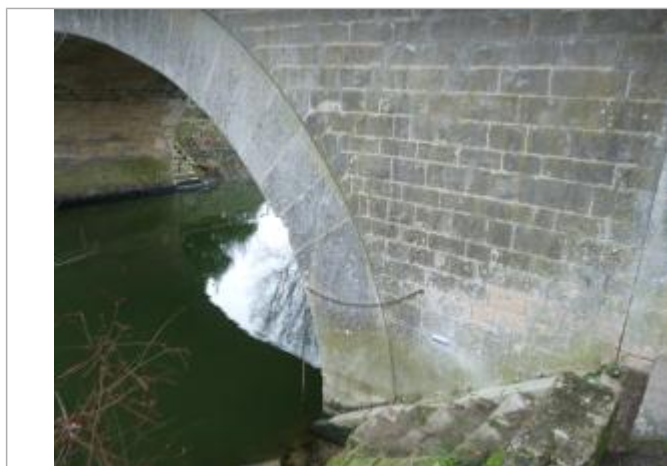
localisation du repère