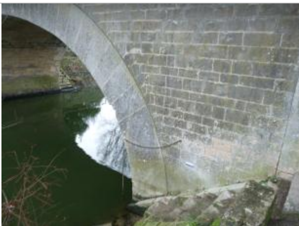
localisation du repère