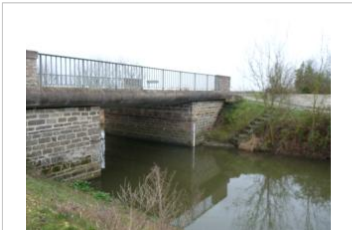
localisation du repère