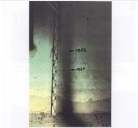
(24425) Commune de Maizac (R.O.) : Ancien moulin Laisse de crue de 1952 (173,85 mNGF) et 1977 (173,56 mNGF) à l'intérieur

Photo du recensement d'origine. auteur photo : AGERIN