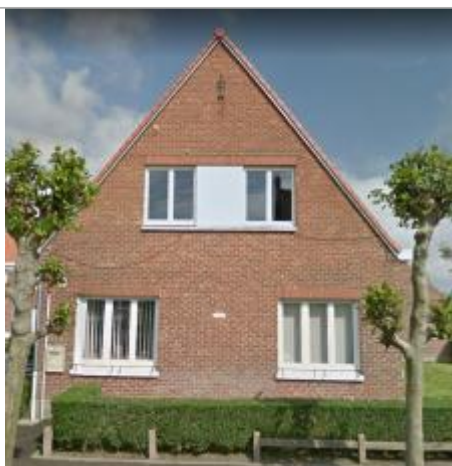
Repère Mairie des Moères

Altitude calculée de l'eau (en m) : 1.923 m