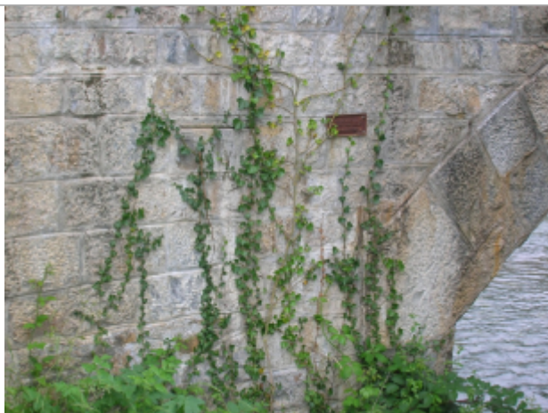
Repères de crue de 1875 et de 1897

Différence entre le niveau d'eau et la référence (en m) : 2.700 m