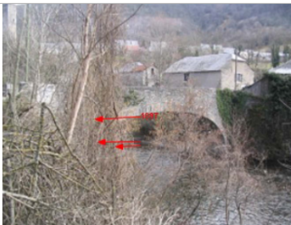
Repère de la crue de 1897

Altitude calculée de l'eau (en m) : 571.51 m