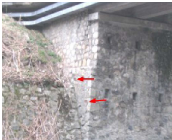
Plaque de la crue de 26/10/1937

Altitude calculée de l'eau (en m) : 646.47 m