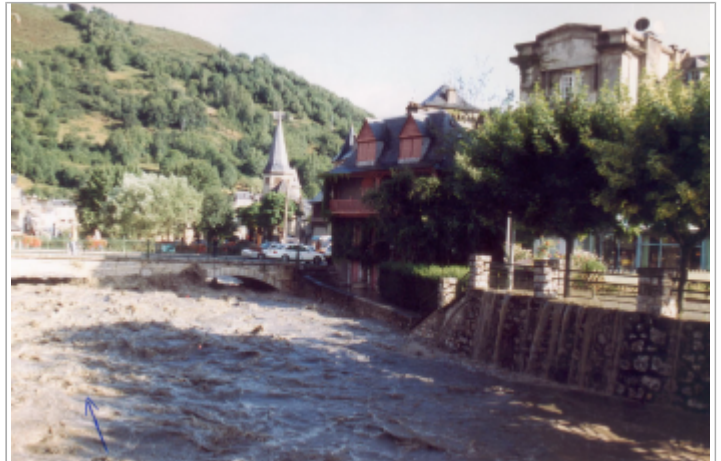
Crue du 05/07/2001