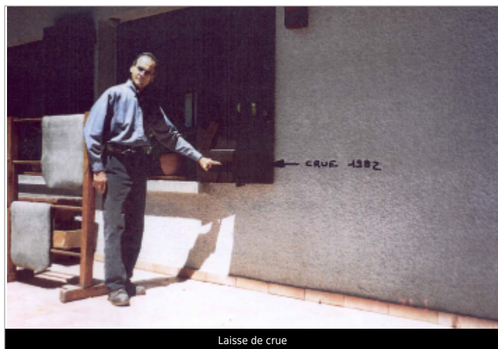
Laisse de crue

LA HAUTEUR D'EAU EST DE 1.10 M PAR RAPPORT AU SOL