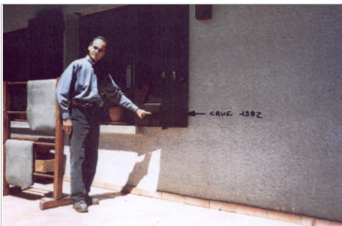
Laisse de crue

LA HAUTEUR D'EAU EST DE 1.10 M PAR RAPPORT AU SOL