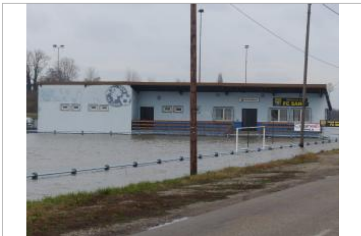
Repère nivellable au niveau des barrières du stade de foot, quelque centimètres en dessous du maximum