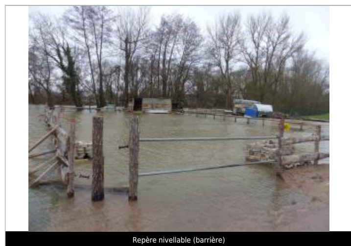
Repère nivellable (barrière)