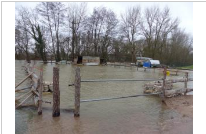
Repère nivellable (barrière)