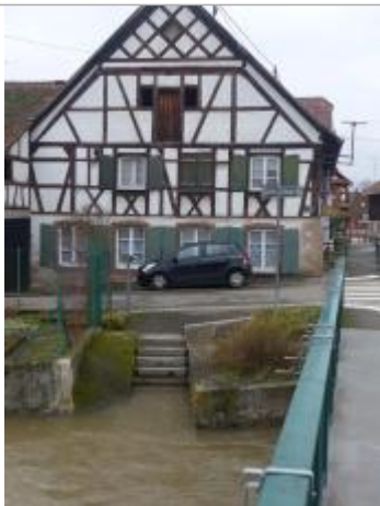
laisse d'inondation sur escalier - vue d'ensemble