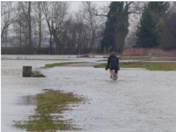
route secondaire inondée par débordement de l'III