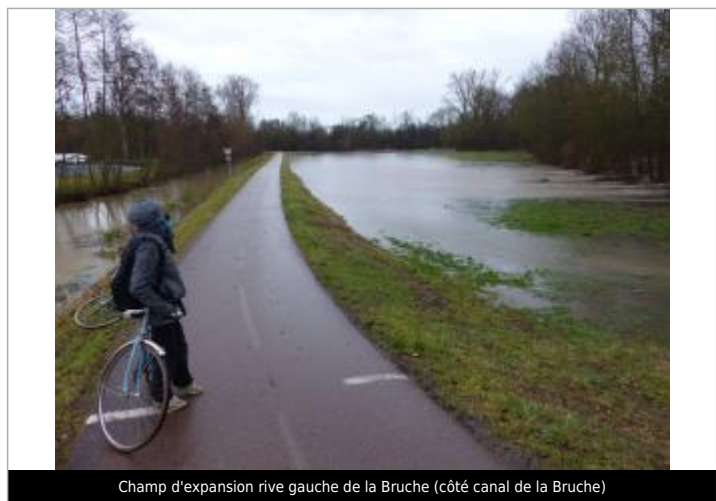
Champ d'expansion rive gauche de la Bruche (côté canal de la Bruche)