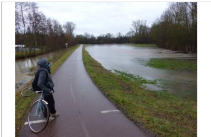
Champ d'expansion rive gauche de la Bruche (côté canal de la Bruche)