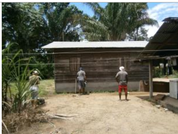
Vue du support de la mesure

Différence entre le niveau d'eau et la référence (en m) : 0.400 m