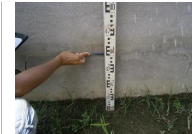
Vue globale du bâtiment

Coordonnées WGS84 : X: -54.41449100 / Y: 4.61726099