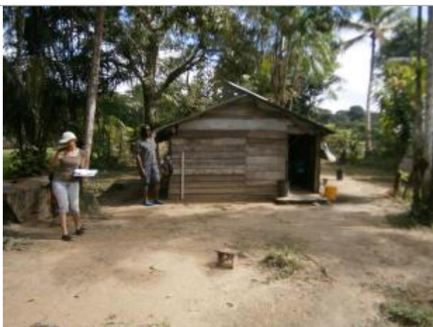
Vue du support de la mesure

Différence entre le niveau d'eau et la référence (en m) : 0.640 m