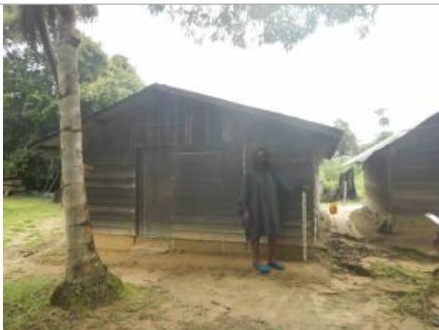
Vue du support de la mesure

Différence entre le niveau d'eau et la référence (en m) : 0.350 m