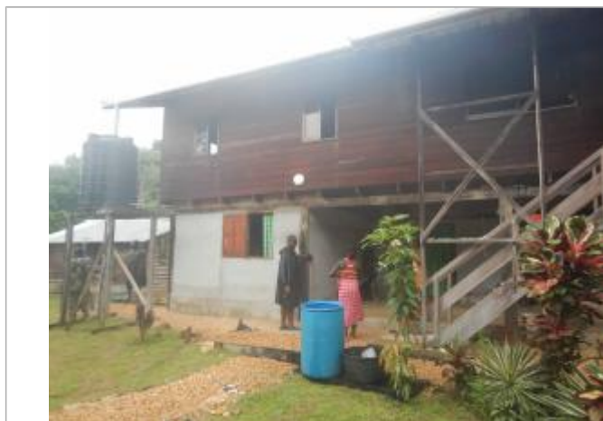
Vue du support de la mesure