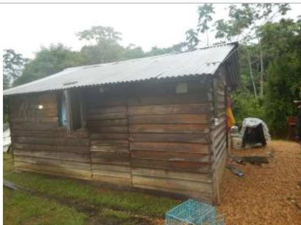
Vue du support de la mesure

Différence entre le niveau d'eau et la référence (en m) : 0.710 m