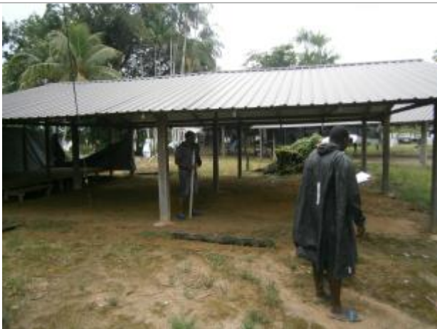
Vue du support de la mesure

Différence entre le niveau d'eau et la référence (en m) : 1.000 m