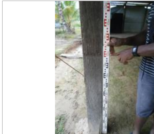
Vue globale du bâtiment

Coordonnées WGS84 : X: -54.47087600 / Y: 4.88672899