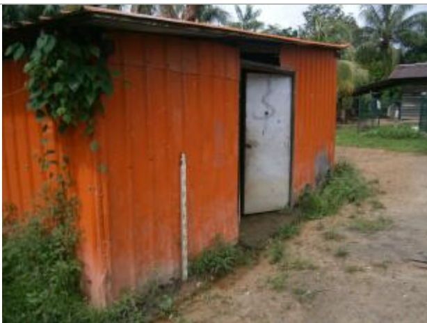
Vue du support de la mesure

Différence entre le niveau d'eau et la référence (en m) : 0.170 m