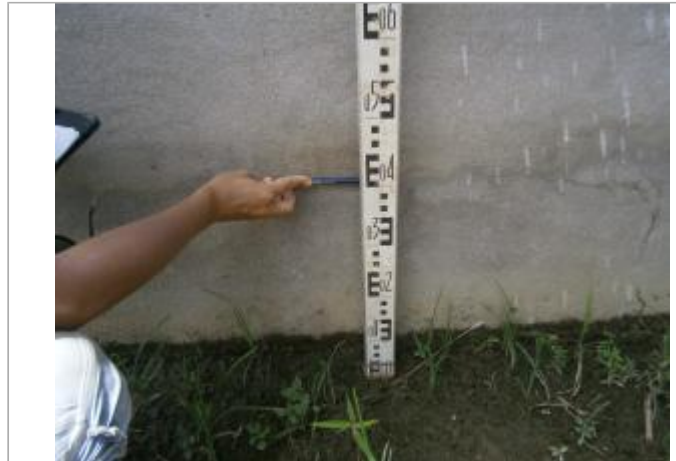
Vue globale du bâtiment

Coordonnées WGS84 : X: -54.41449100 / Y: 4.61726099