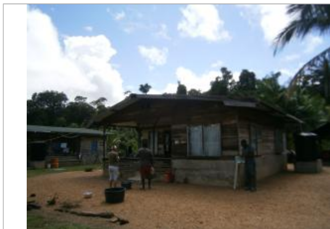
Vue du support de la mesure

Différence entre le niveau d'eau et la référence (en m) : 0.200 m