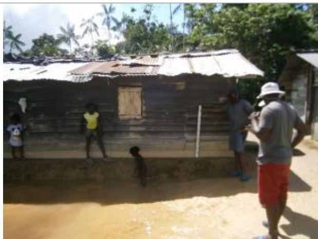
Vue du support de la mesure

Différence entre le niveau d'eau et la référence (en m) : 0.500 m