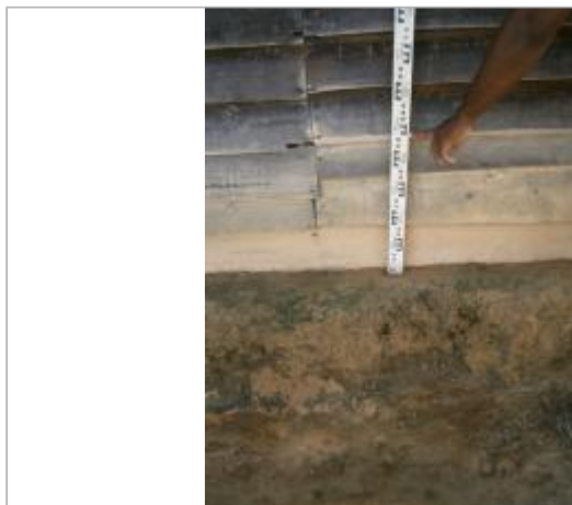
Vue globale du bâtiment

Coordonnées WGS84 : X: -54.42809000 / Y: 4.63119799