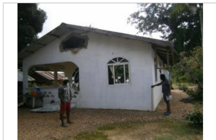
Vue du support de la mesure