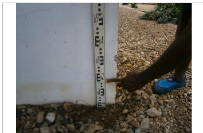
Vue globale du bâtiment