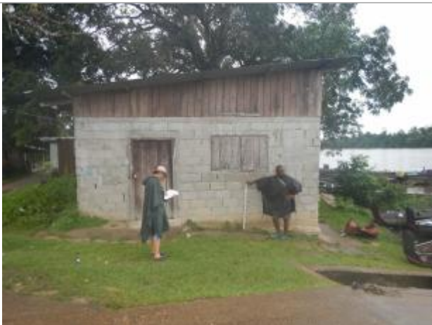
Vue du support de la mesure

Différence entre le niveau d'eau et la référence (en m) : 0.330 m