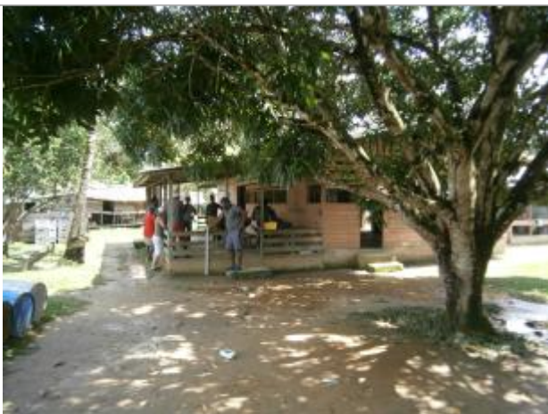
Vue du support de la mesure

Différence entre le niveau d'eau et la référence (en m) : 0.420 m