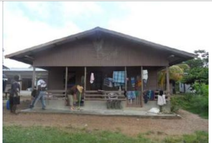
Vue globale du bâtiment

Coordonnées WGS84 : X: -54.42050000 / Y: 4.61661685