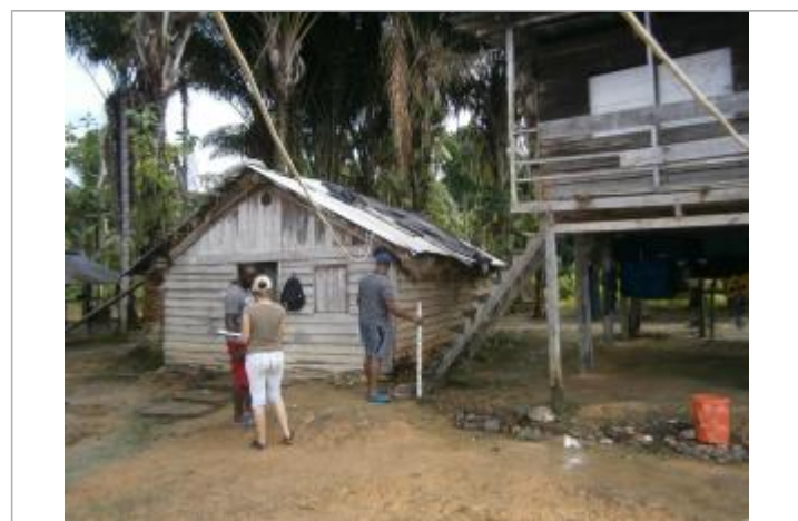
Vue du support de la mesure