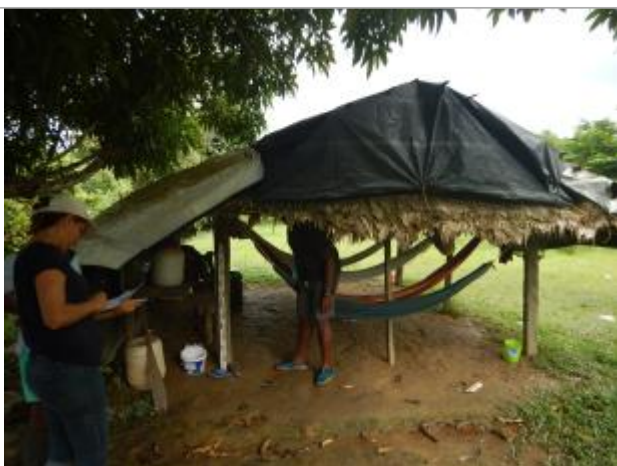
Vue du support de la mesure

Différence entre le niveau d'eau et la référence (en m) : 0.810 m