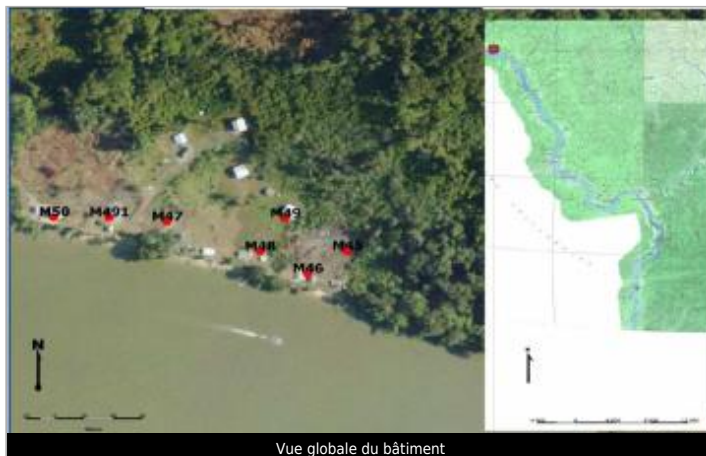
Vue globale du bâtiment