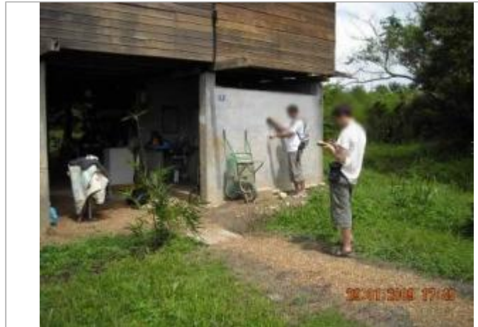
Vue globale du bâtiment