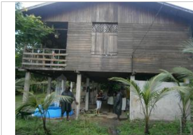
Vue du support de la mesure

Différence entre le niveau d'eau et la référence (en m) : 0.610 m