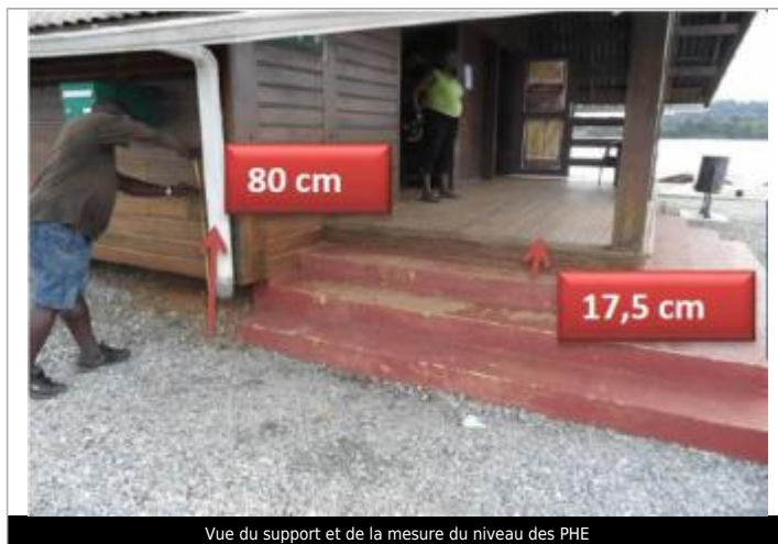
Vue du support et de la mesure du niveau des PHE

Différence entre le niveau d'eau et la référence (en m) : 0.175 m