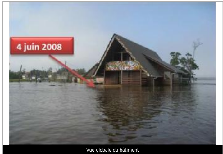
Vue globale du bâtiment