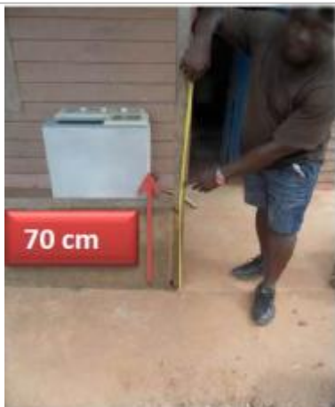
Vue du support et de la mesure du niveau des PHE