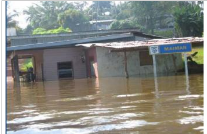
Vue globale du bâtiment