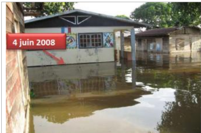
Vue globale du bâtiment

Coordonnées WGS84 : X: -54.34445500 / Y: 5.15558481