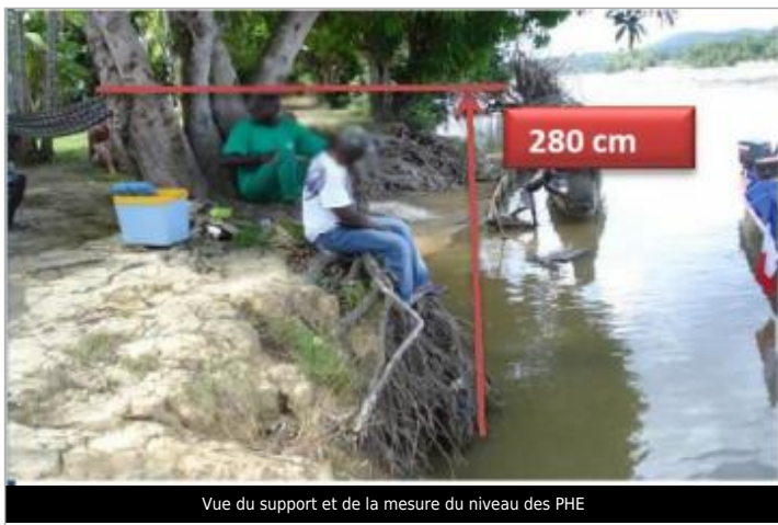
Vue du support et de la mesure du niveau des PHE