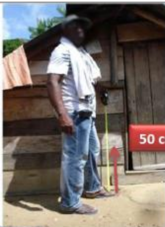
Vue du support et de la mesure du niveau des PHE