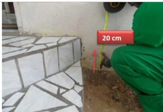
Vue du support et de la mesure du niveau des PHE