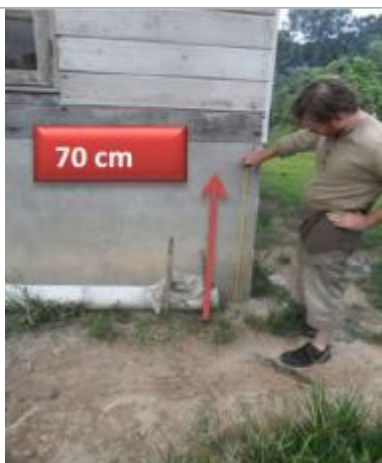
Vue du support et de la mesure du niveau des PHE