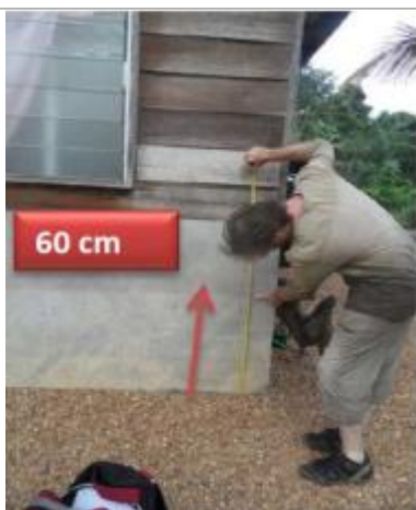
Vue du support et de la mesure du niveau des PHE