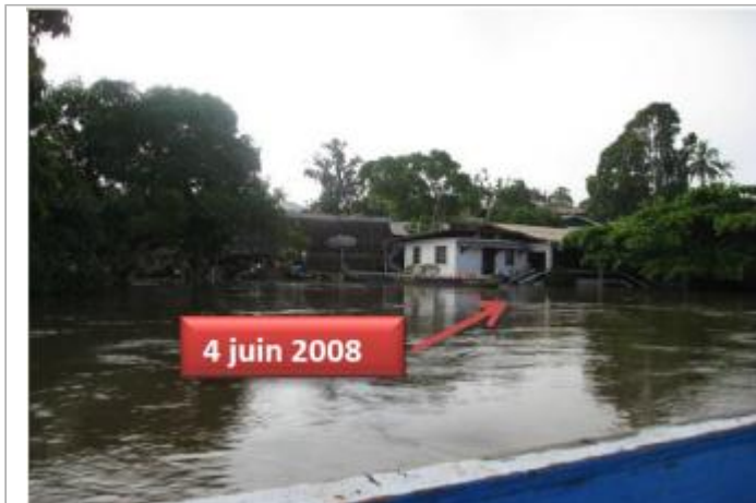
Vue globale du bâtiment