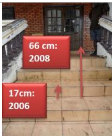
Vue du support et de la mesure du niveau des PHE

Différence entre le niveau d'eau et la référence (en m) : 0.660 m