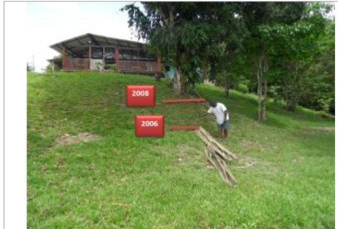
Vue globale du site où se trouve le manguier

Coordonnées WGS84 : X: -54.32730700 / Y: 5.17910225