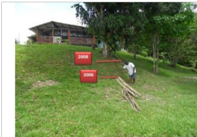
Vue globale du site où se trouve le manguier