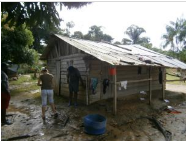
Vue du support de la mesure