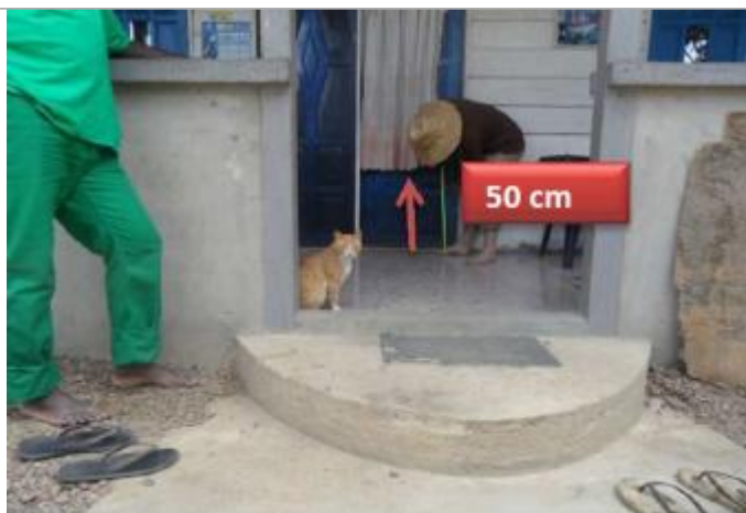
Vue du support et de la mesure du niveau des PHE

Différence entre le niveau d'eau et la référence (en m) : 0.500 m