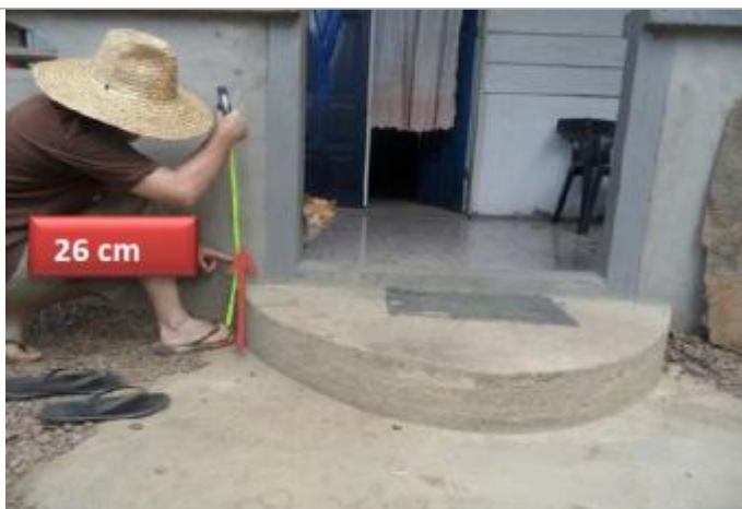
Vue du support et de la mesure du niveau des PHE