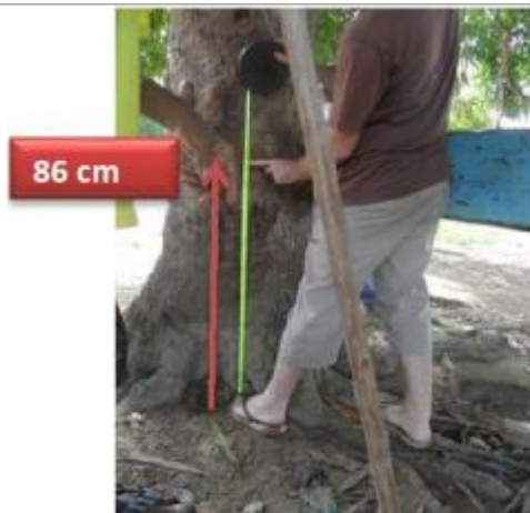
Vue du support et de la mesure du niveau des PHE